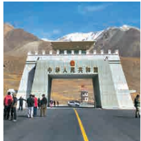
▲中巴邊界的紅其拉甫山口 資料圖片

分析人士指出，隨着喀喇崑崙公路（中巴公路）的全線貫通，中巴陸路貿易、中國和南亞西亞貿易將迎來快速增長期。