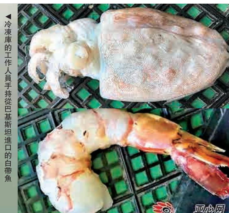
▲從巴基斯坦進口的魷魚和蝦仁 網絡圖片