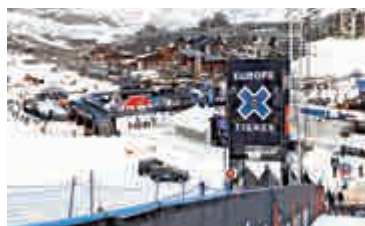
▲法國阿爾卑斯山蒂涅滑雪區

雪崩於當地時間早上10點35分在阿爾卑斯山滑雪區蒂涅發生。今天的雪崩有400米闊，危險程度屬於三級（最高為五級）。救援人員最初發現兩人死亡，兩人生還，但獲救的生還者其後宣告不治。這四名死者都屬於一個登山團，由八名登山客和一名嚮導組成。當局派出兩架直升機、救援人員和警犬搜