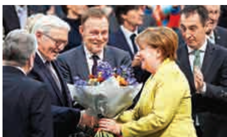
▲德國總理默克爾（右）12日向新當選總統的施泰因邁爾（左二）獻花

戰後德國第12任總統。英國《金融時報》稱，施泰因邁爾的當選在某種意義上標誌着默克爾的戰術失敗，此前她自己領導的執政聯盟基民盟（CDU）和基社盟（CSU）未能提名一個候選人，不得不支持施泰因邁爾獲得提名。