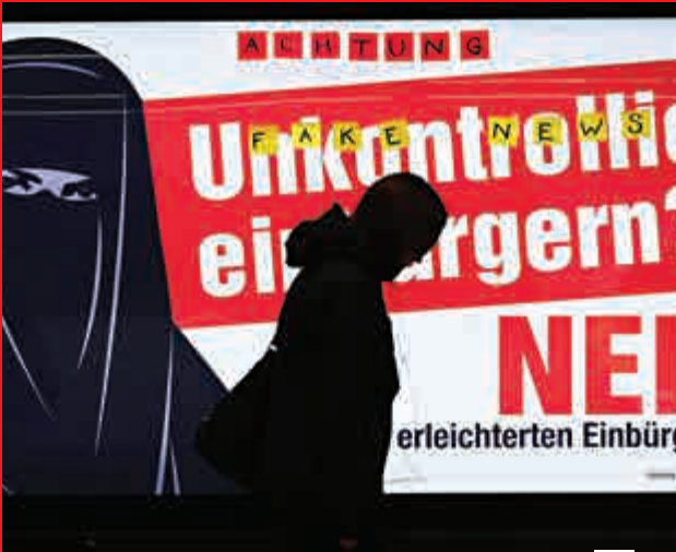
▲瑞士街頭呼籲民眾投反對票的海報 網上圖片

【大公報訊】綜合法新社、美聯社、英國廣播公司報道：瑞士民眾12日舉行公投，超過六成人同意簡化手續，放寬第三代移民的入籍條件。這令大打反移民牌的右翼民族主義政黨感到失望，反對陣營此前在宣傳海報上，還暗指放寬入籍條件會令瑞士「伊斯蘭化」。