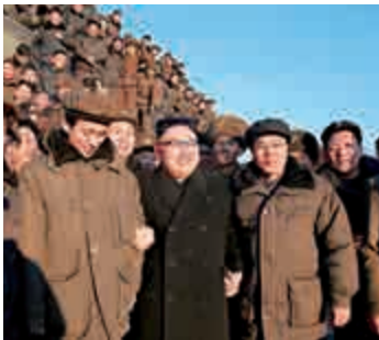
▲朝鮮領導人金正恩（前中）12日到現場指導「北極星-2」發射 路透社

中國外交部發言人耿爽13日表示，中方正密切關注事態發展。安理會決議對朝鮮利用彈道導彈技術進行發射活動有明確規定，中方反對朝方違背安理會決議進行發射活動。當前形勢下，有關方不應做相互刺激，加劇地區局勢緊張的事。各方都應保持克制，共同維護本地區和平穩定。中方認為，朝鮮核導問題根源在於朝美、