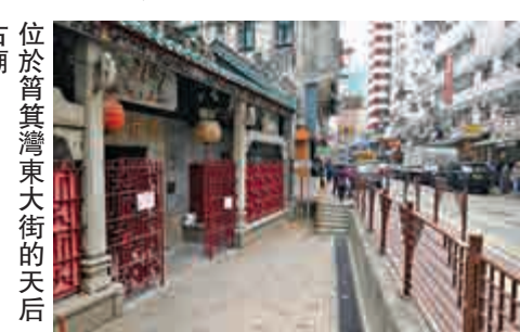
位於筲箕灣東大街的天后廟