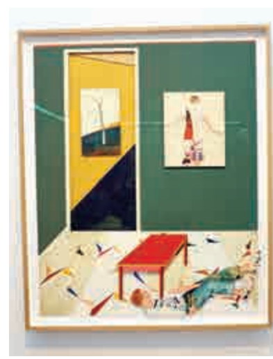
▲延斯·梵歌二〇一六年作《Sister Feelings》