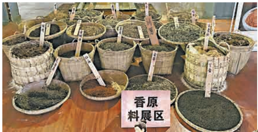
▲小岡香的原材料全部都是天然產品，對人體無害