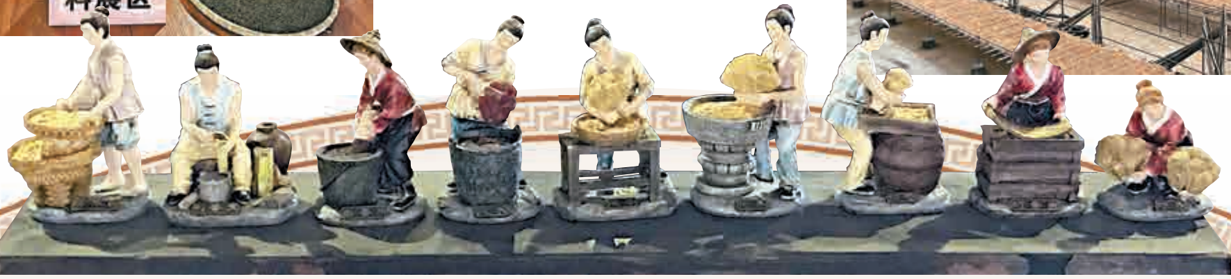
▲在「國天香」的廠房裏，工人正在晾曬製好的線香