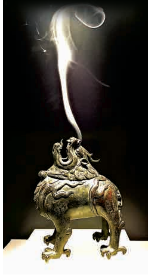
▲在中國傳統文化中，焚香弄琴可謂風雅之至