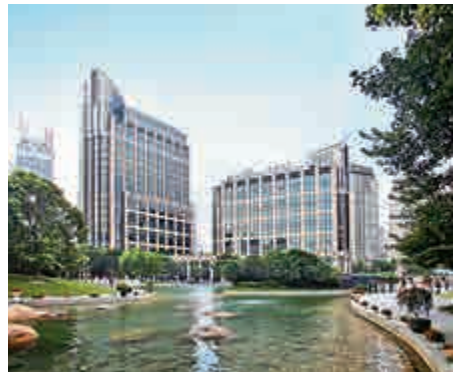
領展上海企業天地1及2號以高達89分的卓越表現，成為中國建築物中取得LEED-EBOM鉑金級綠色建築認證的最高分項目

企業天地1及2號以高達89分的卓越表現，成為中國建築物中取得LEED-EBOM鉑金級綠色建築認證的最高分項目，為一幢落成10多年的物業取得上述認證，領展做了大量工作，包括更換過濾效能高的空氣過濾網，提升室內空氣質素，在大廈管理及清潔方面，採購及使用綠色環保產品或殺菌劑，杜絕有害氣體產生，並透過垃圾分類及收集處理，珍惜天然資源及降低物業營運成本，更通過推廣綠色宣傳及講座，讓租戶及其員工加強環保意識。企業天地1及2號的租戶以跨國企業為主，當中不少熱衷支持環保，亦有利取得該認證。事實上，建築物取得環保建築認證在中國是一個大趨勢，具備該認證有助吸引跨國企業租戶進駐企業天地1及2號。 企業天地的優化工程主要包括：地面大堂上安裝保安閘機，加強保安管理；兩座商廈之間的二樓連廊進行重整改造，美化公用區；整理綠化區，以凸顯大廈的主入口；復修及優化主車道；備用發電機作出系統更新，確保突發情況下快速提供電力等。 企業天地同時亦獲頒上海新天地派出所授予黃浦區治安先進單位榮譽稱號，表揚其對促進公共治安的貢獻。另外，物業揚卸塔及自控系統的節能改造，成功大幅減少耗電量，亦獲黃浦區政府頒發節能示範項目證書，以示獎勵。