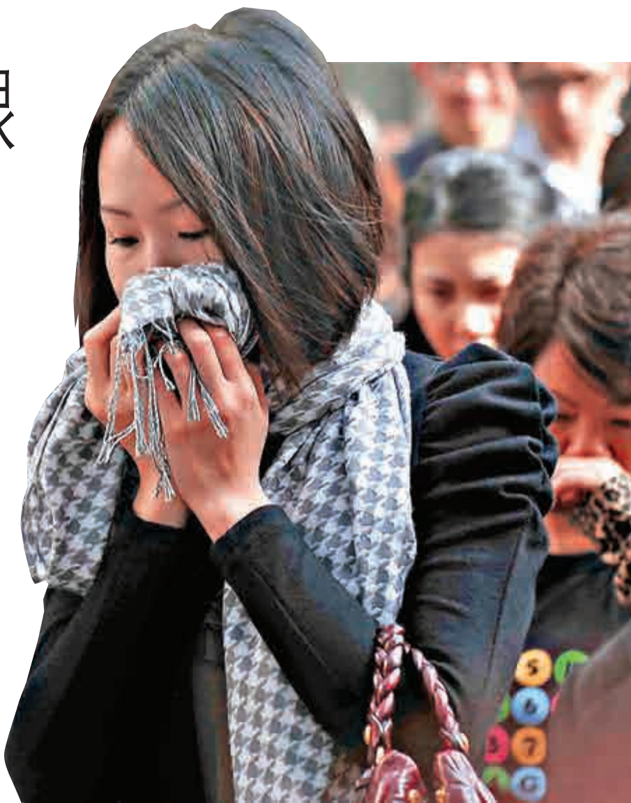
▲汽車廢氣是本港空氣污染的主要成因，多區路邊的PM2.5濃度在繁忙時間「爆表」