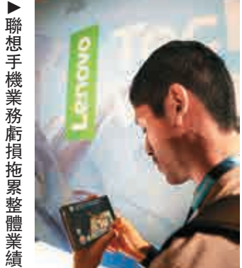
▶聯想手機業務虧損拖累整體業績