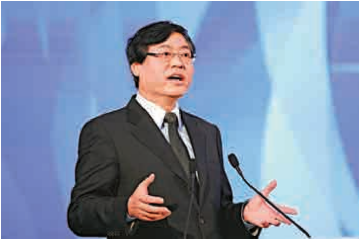
◀聯想集團董事長兼首席执行官楊元慶表示，集團有信心將虧損業務轉盈