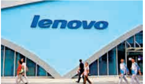
▲聯想業績欠佳遭個別大行下調評級

摩根士丹利指受到意外下跌的業績影響，預期股價反應負面，加上第四季度屬淡季，維持「減持」評級，目標價4.2元。交銀國際亦下調聯想下財年的每股盈利預測，並維持「沽售」評級，目標價3.6元。該行表示，零件價格高企等因素將令聯想移動業務盈利持續受壓，激烈的行業競爭亦會影響數據中心業務表現。