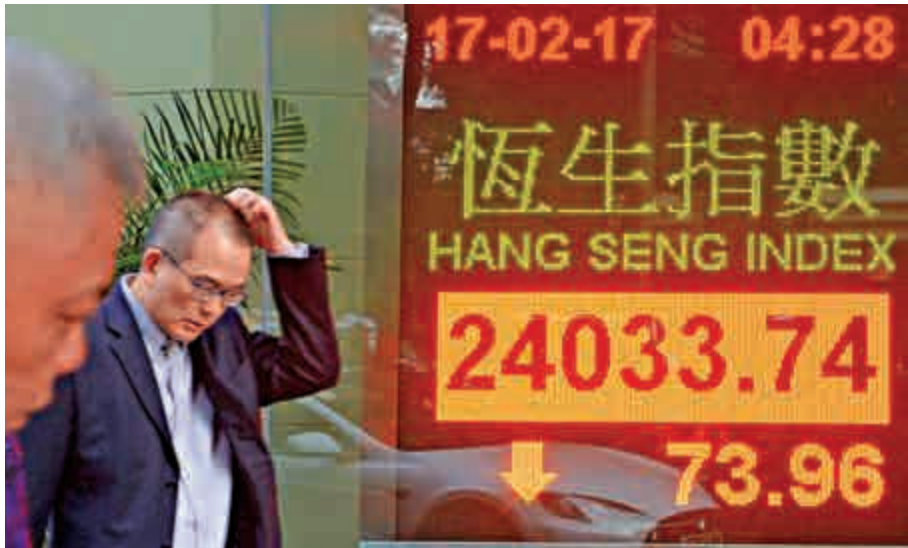
▲恒指昨日曾失守24000關，收市跌幅收窄至73點

展望後市，分析認為，在外圍氣氛轉差的情況下，恒指收市時跌幅仍能夠縮窄，反映大戶信心仍然充足，並不似普通「托沽」伎倆。然而，歐美股市短線調整壓力增加，港股恐難獨善其身，相信下周會先行整固。滙控（00005）周二公布年度業績，投資者要留意滙控管理層會否公布新一輪回購計劃。如果滙控推出新回購計劃，對港股將有刺激作用。