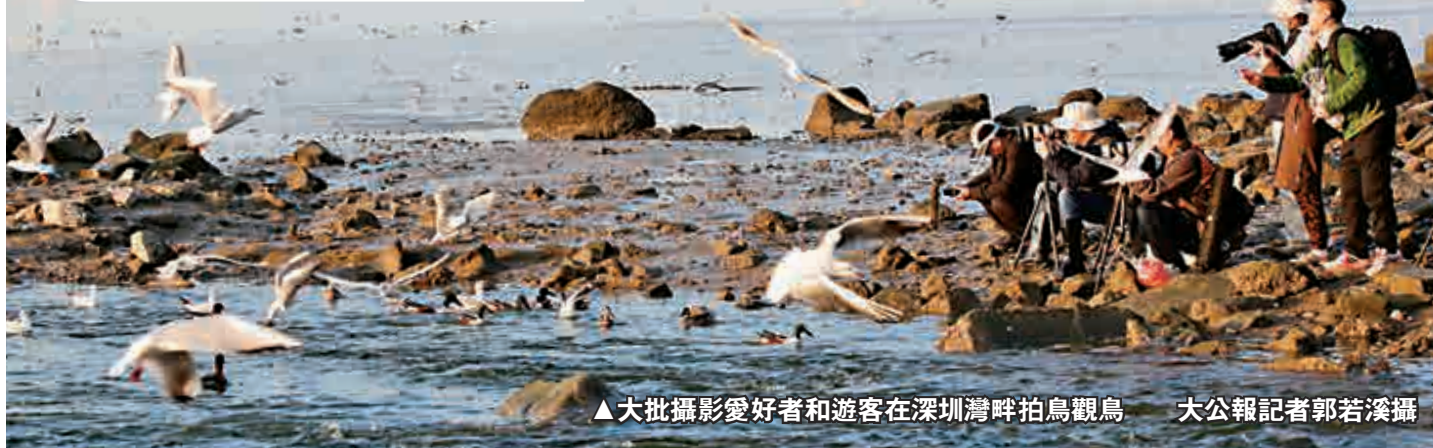
▲大批攝影愛好者和遊客在深圳灣畔拍鳥觀鳥