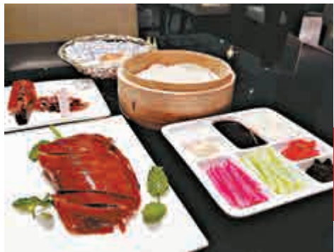
▲▼北京大董烤鴨(上)、聚寶源涮肉火鍋(下) 網絡圖片