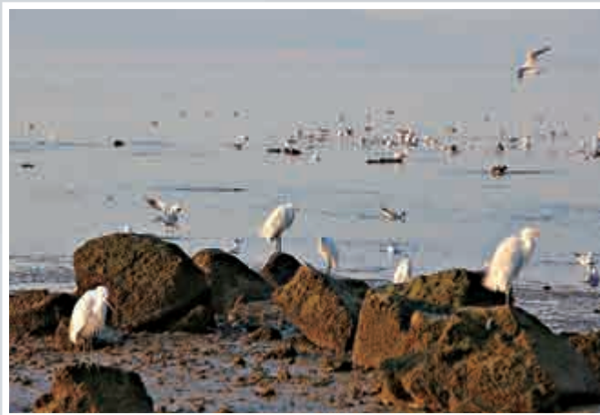
▲成群候鳥棲息在深圳灣畔紅樹林