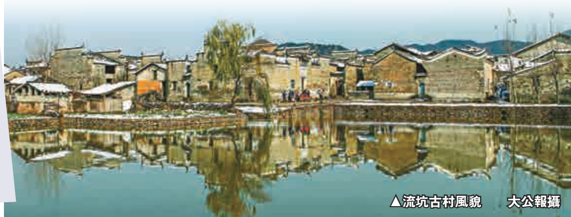
▲流坑古村風貌