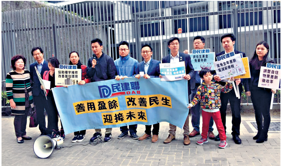
▲民建聯希望政府善用盈餘，改善舊樓及屋宇維修情況

稅務學會前會長王銳強昨日接受電視台訪問稱，預料盈餘逾700億元，相信當局會繼續「派糖」提出紓困措施，但他認為政府更應將資源針對性投放，例如增加教育及醫療支出，或透過稅務優惠等方式，協助產業轉型。中大經濟學系副教授莊太量昨日出席電台節目時指出，盈餘應用以解決長遠問題，包括協助年輕人置業，建議將每年20%賣地或雙倍印花稅收入，撥入作年輕人房屋基金，每年分配約一萬元予18歲以上的青年儲蓄置業。同場的港區全國人大代表劉佩瓊認為，財政盈餘可用於發展有經濟潛力產業，建議政府就香港前景支援基礎設施，維持傳統優勢，追上鄰近地區包括深圳等地的競爭力。