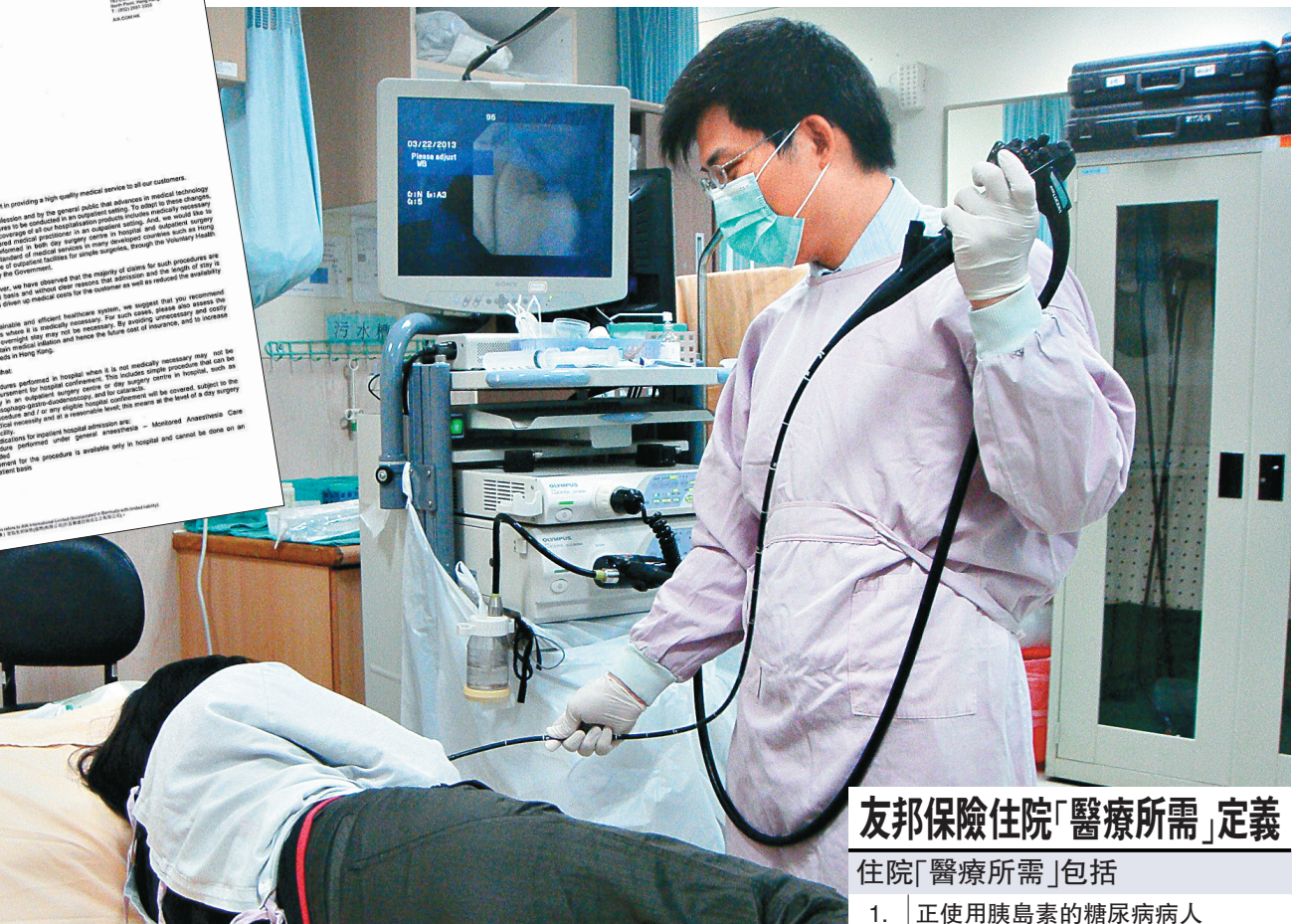
友邦保險住院「醫療所需」定義