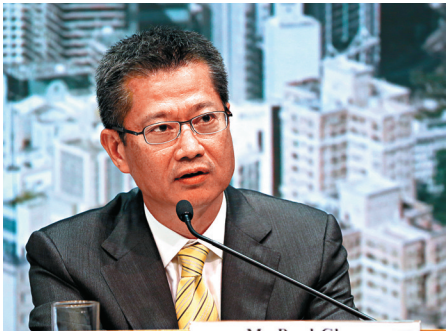
▲財政司司長陳茂波透露，今年政府財政盈餘超乎預期

【大公報訊】記者曾敏捷報道：新一份《財政預算案》將於本周三（22日）出爐，財政司司長陳茂波透露，今年政府財政盈餘超乎預期，主要因賣地收入比預期理想，不少用地成交價高於市場預期。香港稅務學會前會長王銳強預期，政府今年財政盈餘將逾700億元，建議將資源針對性投放，減少「派糖」比例。中文大學經濟