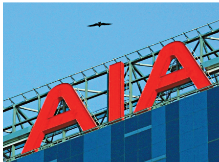
▲友邦保險稱，要對索償個案作出合理監管

友邦指，該公司需為客戶提供合理保障及符合合理水平保費的產品，所以要對索償個案作出合理監管，並與醫生們作適時溝通，亦期望雙方配合，為整體病人取得長遠及可持續的最大利益。