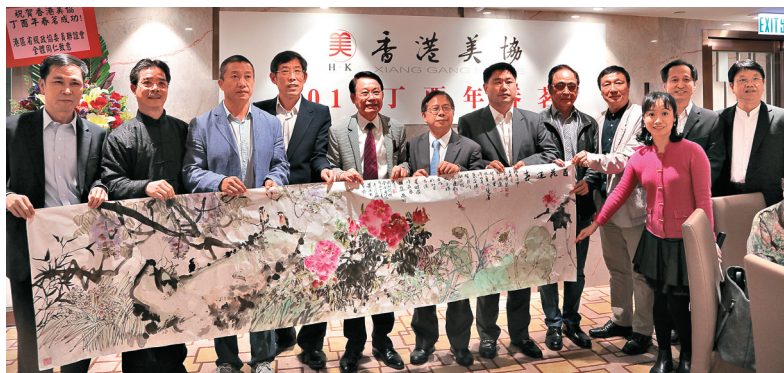
▲香港美協贈《百花迎春圖》予香港國際創價學會

席間，香港美協向香港國際創價學會贈送了一幅由美協多名骨幹成員共同繪製而成的《百花迎春圖》，以增強在港愛國團體之間的友誼與凝聚力。此外，美協表示，本年年會增聘了二十位協會顧問，其中包括張浚生、唐英年、戴德豐、楊孫西、霍震霆等社會知名人士。