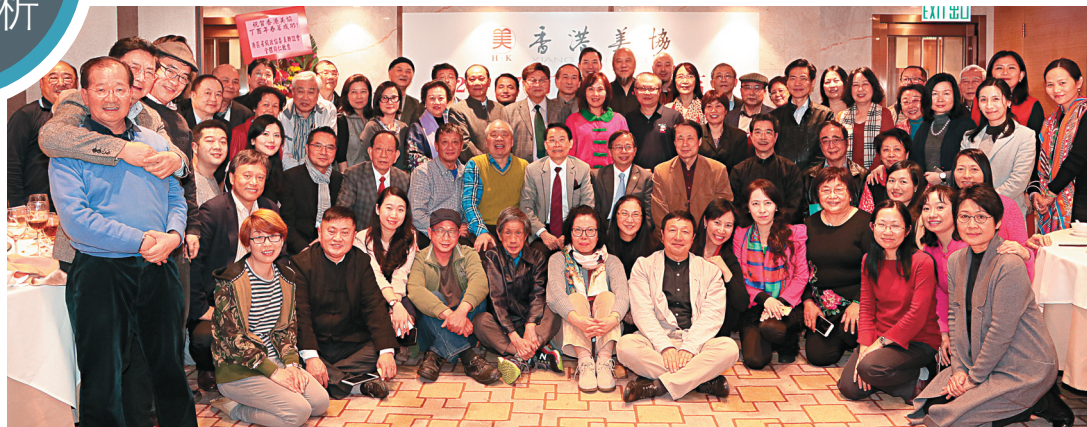
▲香港美協成員春茗合照