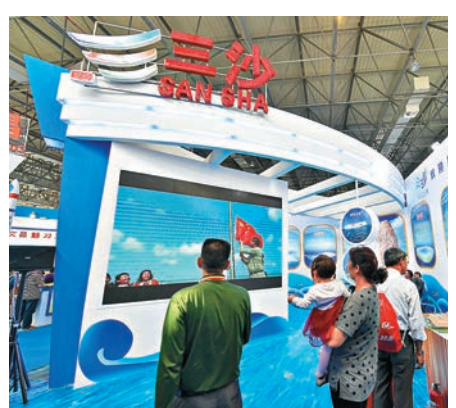
▲在海南旅遊貿易博覽會亮相的三沙市展館

【大公報訊】據中新社報道：海南省長劉賜貴20日在海南省五屆人大五次會議上作《政府工作報告》時表示，海南正推動海洋產業集群化發展，推動構建「泛南海經濟合作圈」。