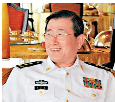
▲東海艦隊原司令員蘇支前海軍中將日前已調任海軍副司令員 資料圖片

北海艦隊原司令員袁譽柏升任南部戰區司令員，其職位由南部戰區副參謀長張文且接任；南海艦隊原司令員沈金龍升任海軍司令員，其職位由海軍原副司令員王海接任；東海艦隊原司令員蘇支前出任海軍副司令員，其職位由南部戰區副司令員兼參謀長魏鋼接任。