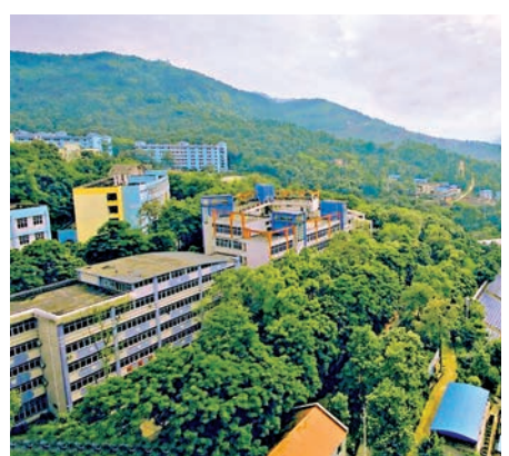
▲民生教育於內地營運民辦高等教育，圖為旗下重慶人文科技學院

根據民生教育去年9月向港交所(00388)遞交的初步上市文件披露，該公司為內地民辦高等教育機構，目前在內地營