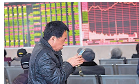
▲傳首批約100億元養老金將劃給管理人，為A股注入動力，銀行股表現突出

【大公報訊】記者章蘿蘭上海報道：據媒體披露，首批養老金權益類組合有望本周打款，將資金劃給管理人，約100億元(人民幣，下同)規模資金大概率投向