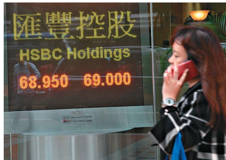
▲滙控今日公布業績，股份回購與否成為市場焦點