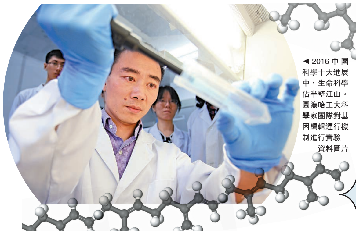
◀ 2016 中國科學十大進展中，生命科學佔半壁江山。圖為哈工大科學家團隊對基因編輯進行機制進行實驗

同時，耿建東指出，中國生命科學研究領域取得快速發展，在基因組測序及其相關分析、結構生物學、幹細胞等領域佔據一定優勢地位，在免疫學、神經生物學、表觀遺傳學等領域取得了豐富成果。