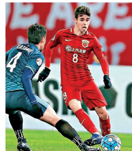
▲上海上港球星奧斯卡（右） 資料圖片

據德國傳媒報道，科隆接獲一家中超球會報價4000萬歐元欲購該名28歲法國前鋒，但遭科隆及當事人拒絕。（踢球者）