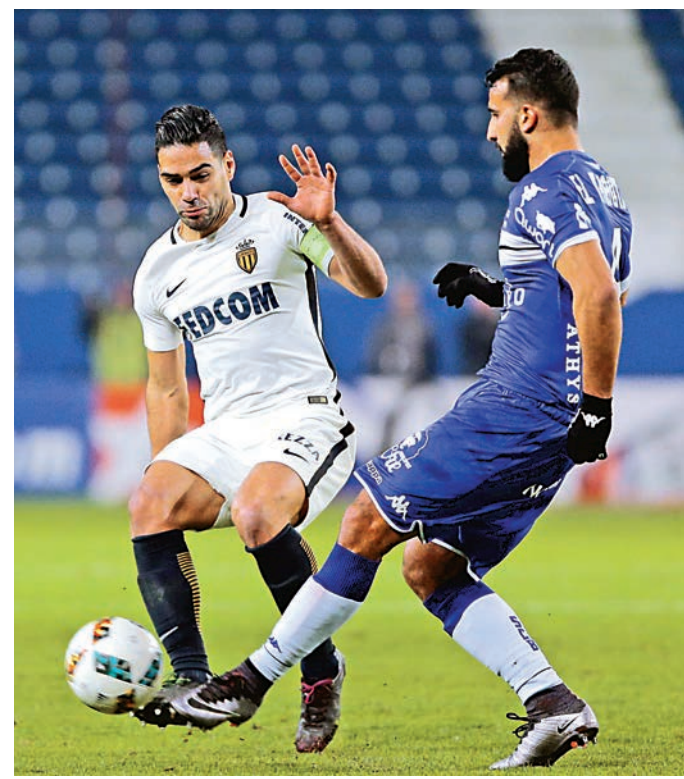
▲摩納哥鋒將法卡奧（左）近況不俗