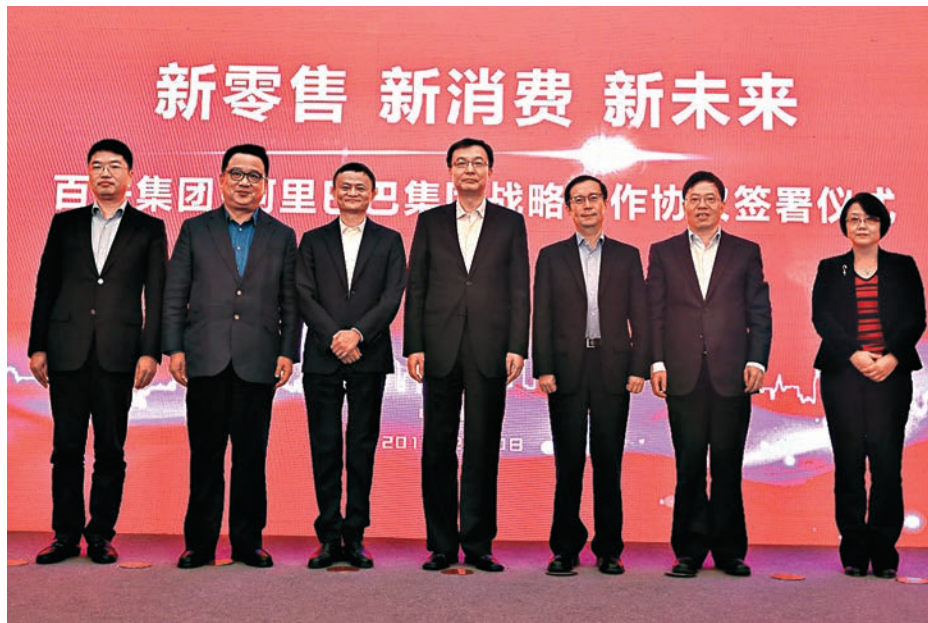
▲（左起）阿里巴巴集團總裁金建杭，百聯集團總裁葉永明，阿里巴巴集團董事局主席馬雲，上海市委常委、常務副市長周波，阿里巴巴集團首席執行官張勇，上海市副秘書長、國資委黨委書記、主任金興明，上海市商務委黨組書記、主任尚玉英出席簽約儀式