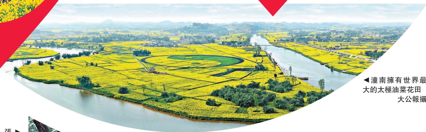
▲潼南擁有世界最大的太極油菜花田

與此同時，該鎮亦組建旅遊開發公司2家，建成太極古鎮、陳搏山等旅遊景點70餘處，開發崇龕菜油、玫瑰精油等旅遊產品23個，吸引遊客在觀光同時順道購買特色土產。