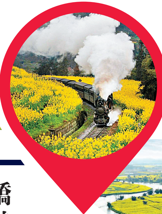
▲重慶潼南擁有被譽為中國最美的油菜花海 網絡圖片