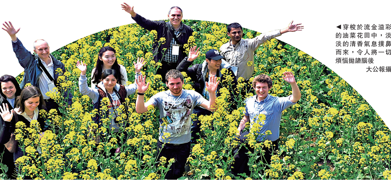
穿梭於流金溢彩的油菜花田中，淡淡的清香氣息撲鼻而來，令人將一切煩惱拋諸腦後

重慶力拓農旅結合，促進特色效益農業與鄉村旅遊緊密融合，充分釋放疊加效應，依託農節時令，營造賞花經濟。近日，該市潼南區油菜花迎來最佳觀賞期。一望無際的花海中，遊客除乘車、乘船賞花外，景區新增空中鳥瞰潼南油菜花遊樂項目，遊客可乘坐直升機從高空鳥瞰，欣賞油菜花姿。數據顯示，最近一周內，崇龕鎮接待遊客10萬人次，人均消費超過500元（人民幣，下同），這個數值較往年增長兩到三倍。