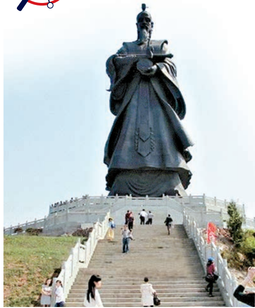
▲崇龕鎮陳搏山高36.9米的陳搏老祖銅像