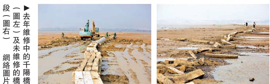
▲去年維修中的千眼橋（圖左）及未維修的橋段（圖右）

由於「千眼橋」在一年中，至少有半年時間浸泡在水裏，加上泥沙風浪衝擊，橋身損壞嚴重。為此，當地專門撥款90萬元人民幣對橋墩、橋面進行維修加固。維修堅持「修舊如舊」的原則，仍採用花崗岩等材料，展現古橋的歷史面貌。（記者 王道）