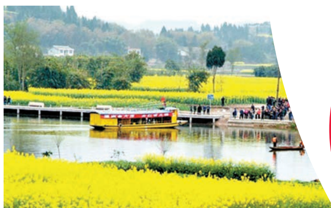
▲遊客亦可選擇乘船，沿着悠悠瓊江順水而下，觀賞兩岸花海

數據顯示，2016年潼南區接待遊客645萬人次，旅遊綜合收入為31.2億元。潼南區是重慶發展農旅結合、打造賞花經濟的一個縮影。春天賞油菜，夏日觀荷花，深秋品菊花，冬季看格桑。去年，重慶系列推出「賞花遊」，打造出「一村一品、一鎮一特色」的賞花經濟，累計接待遊客1.3億人次，綜合旅遊收入達300億元（約為339億港元）。