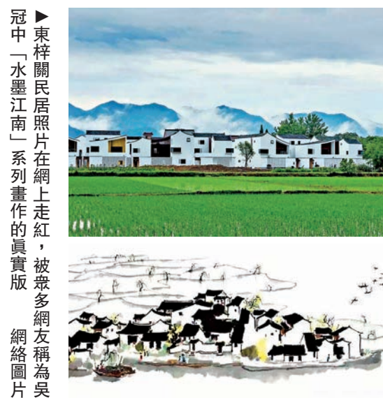
▲東梓關民居照片在網上走紅，被眾多網友稱為吳冠中「水墨江南」系列畫作的真實版