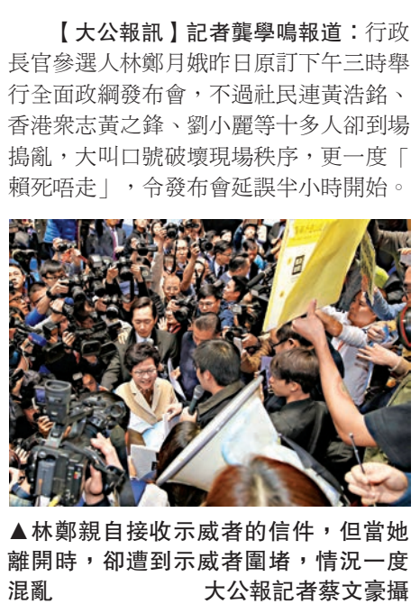
▲林鄭親自接收示威者的信件，但當她離開時，卻遭到示威者圍堵，情況一度混亂

【大公報訊】記者龔學鳴報導：行政長官參選人林鄭月娥昨日原訂下午三時舉行全面政綱發布會，不過社民連黃浩銘、香港眾志黃之鋒、劉小麗等十多人卻到場搗亂，大叫口號破壞現場秩序，更一度「賴死唔走」，令發布會延誤半小時開始。 發布會結束後，他們更一度圍堵林太，場面混亂，其間背景板被拆爛。各界譴責這種暴行，批評搞事者對人不對事。 政綱發布會原訂下午三時舉行，不過黃浩銘、黃之鋒、劉小麗等十多名社民連及香港眾志成員，於正式開場前十多分鐘前來「踩場」，要求林鄭交代全民退保、23條立法、「8·31」決定等立場。黃浩銘聲稱，不是要踩場，而是「斯文表達訴求」，不過他們卻高叫「我要真普選」、「反對政府覆核議員資格」等口號，完全無視記者會即將進行。他們又聲稱要求與林太「connect」，拒絕離開。 後來競選辦主任陳智思於三時十分前來，勸喻示威者離開，又強調林太願意與他們對話，並願意接信，示威者不肯離開，陳智思後來容許留下，但表明出現阻礙記者會的情況，就會請保安請他們離開。最終記者會延遲至三時半才開始。