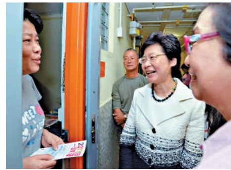
▲逾半市民支持林鄭做特首 資料圖片

三成六的受訪者支持林鄭月娥出任行政長官，曾俊華有三成五受訪者支持，林鄭月娥支持度首次領先。調查又問及受訪者認為最有機會出任行政長官的人士，54%受訪者認為是林鄭月娥，其次有28%人認為是曾俊華，再次為胡國興(3%)及葉劉淑儀(2%)。結果反映多數市民相信林鄭月娥的勝算較高。 此外，經濟通兩周前發起的特首參選人網上民調，截至昨夜11時為止，共有5239人投票，有四成七受訪者支持林鄭月娥，冠絕