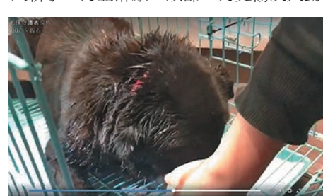
▲流浮山虐狗案，唐狗女Yan Yan傷及大動脈

【大公報訊】元朗流浮山上周六揭發虐狗案。一頭黑色唐狗女，被人發現受傷匿在貨櫃底下，動物權益組織的義工接獲通知往現場找到受傷狗女，發現牠至少被人斬了七刀並淋尿，頭部一刀更傷及大動脈，義工立即將牠送往獸醫治理。經三小時手術，唐狗女暫時渡過危險期，警方將案件暫列作殘酷對待動物案，呼籲目擊者供資料。