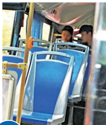
個案1 ▲一對身穿校服的情侶，過關後卿卿我我，登上巴士後態度親密

●要求未滿11歲的兒童須在家長陪同下出入境，跨境學童家長可親身或透過學校向當局登記，可在保姆陪同下出入境。不過，年滿11歲的兒童則可使用智能身份證自由出入境，對這些未成年的兒童安危，難有保障。