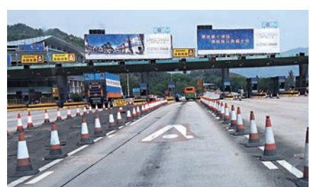
▲大欖隧道收費廣場外發現9000多元紙幣

視錄影，發覺事發前先後有兩部車停在上址路邊，其中一輛白色私家車先在路邊停下，在離開後即有鈔票掉在地上，未幾，另一輛中型貨車駛至停下，見有人落地疑在執拾物件，警方正調查該批鈔票離奇散在路邊的真相，暫列作發現財物案跟進。