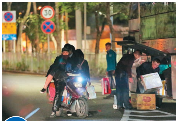
個案2 ▲另一名女學生傍晚過關後，竟登上一名內地年輕男子駕駛的電單車離去