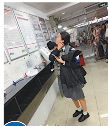
個案3 ▲有女學生更疑似從事水貨活動，經羅湖過關後便到附近的天天快遞遞包裹