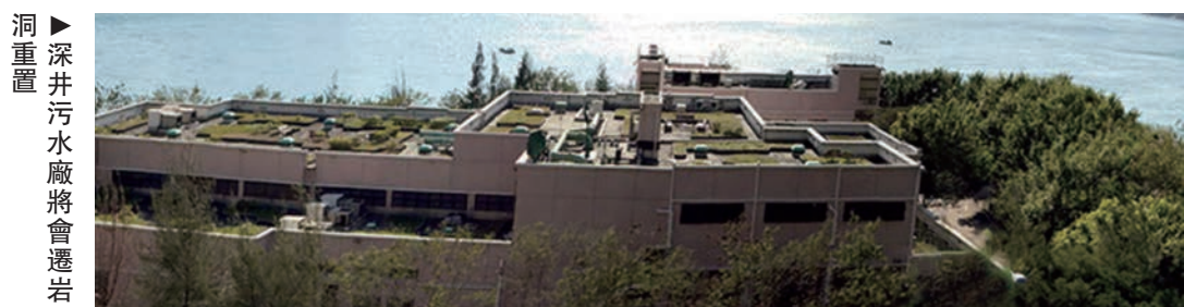
深井污水處理廠將會遷岩洞重置

當局表示，已就兩個方案進行初步技術可行性評估，認為各方案在土力、交通、環境、景觀、園景及空氣流通等方面，皆不會對周邊環境產生不良影響。當局將於本月隨後展開第二階段公眾諮詢，以向區議會、公眾及有關團體收集進一步意見。