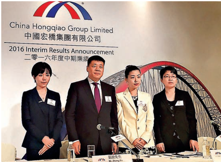
◀中國宏橋在不足半年內兩次遭到沽空機構狙擊，圖為公司管理層資料圖片

事實上，去年11月23日，網站Hongqiao Exposed就已指出宏橋財務造假，惟宏橋當日股價並未出現大幅波動，收市更升2.46%。宏橋當日發通告指，報告中有關指控是單方面及誤導性猜測，不排除有人為了打擊市場對集團業務、管理層及聲譽的信心，宏橋保留採取法律行動的權利。隨後更在12月20日，以公告的形式對沽空報告進行了反駁，其董事認為報告中的指控毫無根據。