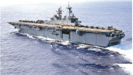
▲美軍「好人理查德」號兩棲攻擊艦 資料圖片

【大公報訊】據中通訊社報道：美國海軍黃蜂級兩棲攻擊艦「好人理查德」號近日出現在中國東海，並在航行中進行補給工作，此時美國海軍尼米茲級核動力航空母艦「卡爾·文森」號仍在南海訓練。