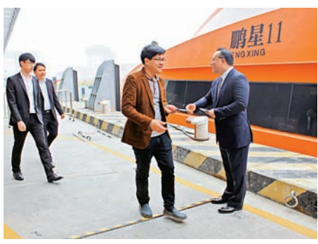
▲深圳增開「蛇口至中環」航班，由蛇口到中環只需55分鐘

深圳航運集團表示，3月1日起，蛇口郵輪中心至香港中環航班已由原先的10班增至平日16班次，周末18班次，周末增加的尾班船從香港中環出發最晚時間為20：30，從深圳出發最晚19：15。蛇口至中環（單程）普通艙票價120元（人民幣，下同）、頭等艙票價150元、兒童票價70元。