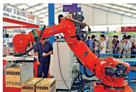
▲佛山將於年內啓建國家級製造業創新中心

【大公報訊】記者方俊明佛山報道：「製造業大市」佛山正攜手廣州打造珠三角灣區世界級城市群核心。記者2日從佛山