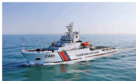
▲消息指中國海警船將於今年八月到訪馬尼拉港

邦義利蘭拒絕進一步詳細說明。當被問及中海油是否已經有回覆時，他告訴記者：「我不能說。」