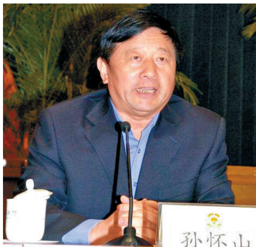
全國政協常委孫懷山涉嫌嚴重違紀被查，成今年兩會「首虎」

1999年至2008年，孫懷山任十屆全國政協副秘書長、機關黨組成員。隨後的八年時光，他先後擔任十一屆全國政協常委、副秘書長、機關黨組成員、機關黨組書記；十二屆全國政協常委、常務副秘書長、機關黨組書記（正部級）；十二屆全國政協常委、常務副秘書長、機關黨組副書記（正部級）。