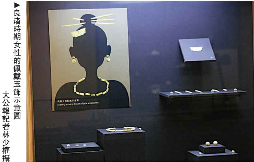
良渚時期女性的佩戴玉飾示意圖