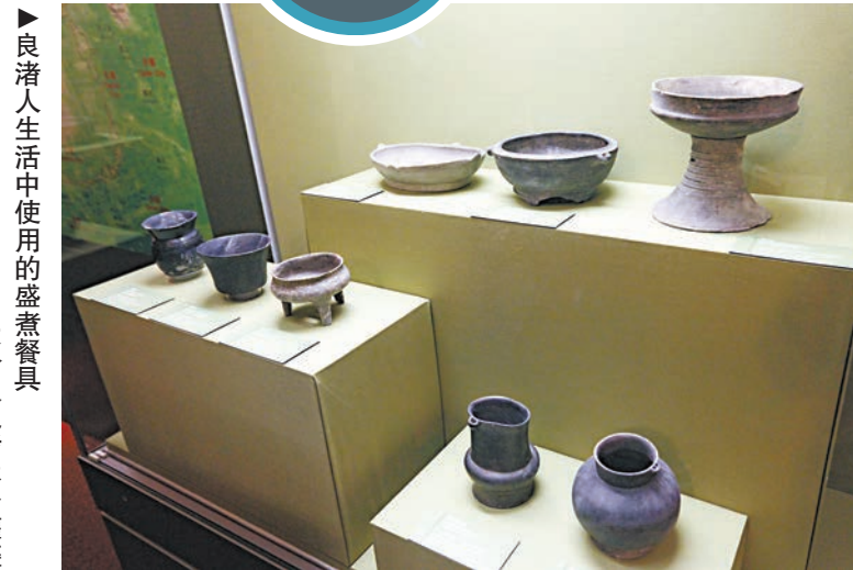
良渚人生活中使用的盛煮器具