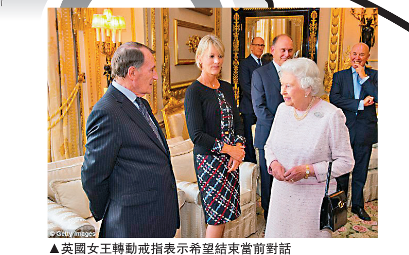
▲英國女王轉動戒指表示希望結束當前對話