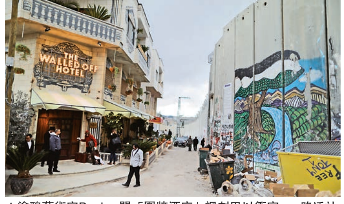
▲塗鴉藝術家Banksy開「圍牆酒店」諷刺巴以衝突

【大公報訊】據法新社報道：英國著名塗鴉藝術家Banksy在巴勒斯坦城市伯利恆開了一家「圍牆酒店」（Walled Off Hotel），距離在西岸、用來分隔以色列和巴勒斯坦領土的圍牆只有四米遠，酒店的所有房間都可以看到圍牆。Banksy和許多畫家都在圍牆上留下了他們的作品，以表達對以巴衝突的強烈不滿。 「圍牆酒店」一共設有九個房間，其中七間由Banksy一手設計，另外兩間分別由加拿大和巴勒斯坦畫家設計。酒店多個房間的景觀望到的是以色列保安瞭望塔，Banksy對此表示，這家酒店「提供了全世界最糟糕的景觀」。 房間的室內設計有許多充滿諷刺意味的作品，「Banksy房」的牆壁上是一幅由他本人設計的巴勒斯坦人和以色列人枕頭大戰的畫作，另一個房間的牆壁則是無人機模型裝飾和耶穌前額被狙擊手點中的畫像。 「圍牆酒店」一共耗費14個月完成，將於3月11日正式開張。Banksy強調，他本人並不從屬於任何政黨或壓力團體，歡迎各方人士入住，最便宜的房間每晚收費僅30美元（約235港元）。 按照Banksy要求，「圍牆酒店」是在完全保密的情況下籌建起來，聘用的員工全是當地人，直到周五他們才得知酒店主人的身份。