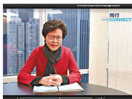
▲林鄭月娥回顧過去一周的工作。林鄭fb圖決問題。在未來三周，她會繼續努力爭取選委支持，亦希望得到市民大眾的認同。行政長官候選人還有曾俊華和胡國興。