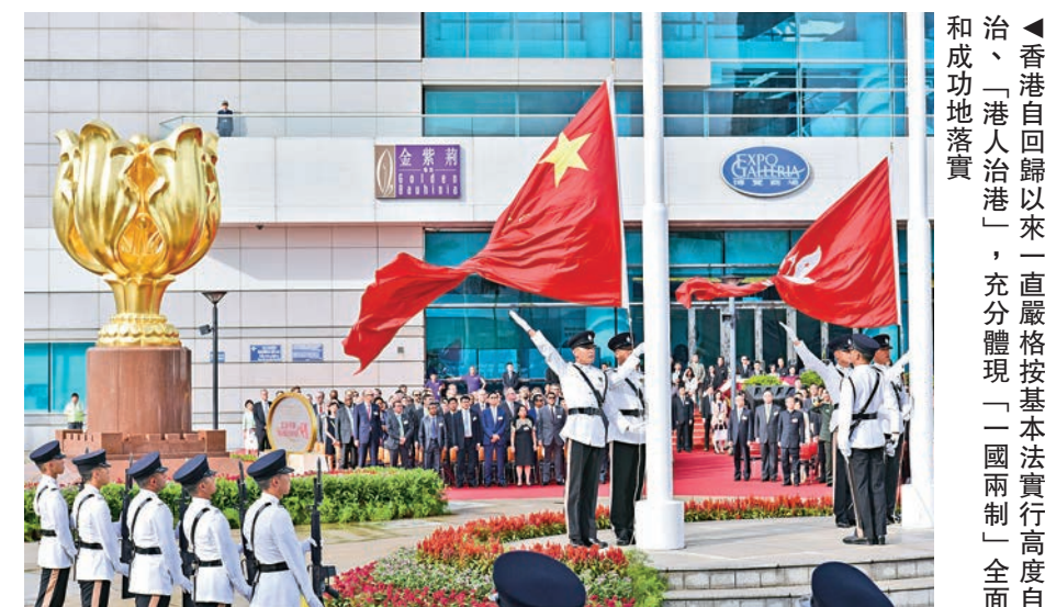
◀香港自回歸以來一直嚴格按基本法實行高度自治、「港人治港」，充分體現「一國兩制」全面和成功地落實。

駐港公署又強調，香港是中國的特別行政區，香港事務純屬中國內政，任何外國政府無權以任何形式加以干涉。