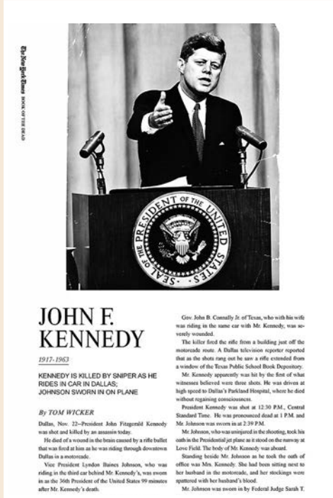
▲《The New York Times Book of the Dead》書中約翰甘迺迪的訃告（部分），由時任《紐約時報》主筆Tom Wicker撰寫