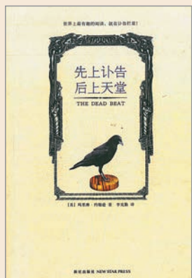
▲簡體中文版《先上訃告 后上天堂》（新星出版社，2007）

編者註：《紐約時報》訃告版網址：www.nytimes.com/section/obituaries。