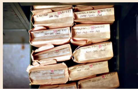
▲Jeff Roth稱，卡斯特羅的剪報比其他任何人都多，「除了總統、君主和教皇」