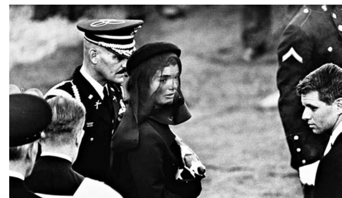
▲一九六三年十一月，積琪蓮甘迺迪於丈夫約翰甘迺迪的葬禮（Elliott Ervitt攝，書中圖片） © Elliott Ervitt/Magnum Photos