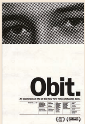
▲電影《訃告》海報 © Green Fuse Films