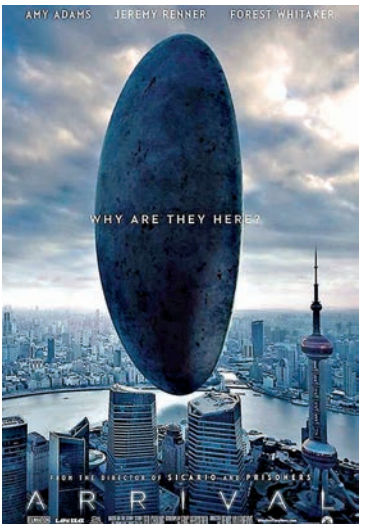
▲電影《天煞異降》海報

何破譯「七肢桶」的語言「七文」、如何因為這個過程改變了自己的認知能力。故事簡單，描述的卻是語言背後認知和思維的波瀾壯闊。