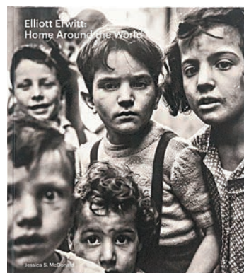
▲《Elliott Ervitt: Home Around the World》（Aperture，2016）

Elliott Ervitt一九二八年出生於巴黎的俄羅斯猶太家庭，四一年移民紐約，五三年加入馬格蘭攝影通訊社，六十年代擔任該社主席三年。現年八十九歲的Ervitt，上一次親臨香港是在一四年九月，為香港F11攝影博物館的開幕展「Elliott Ervitt: Best in Show」揭幕。