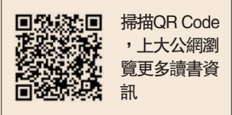
掃描QR Code，上大公網瀏覽更多讀書資訊