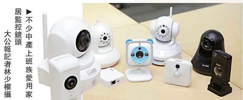
不少中產上班族愛用家居監控鏡頭。