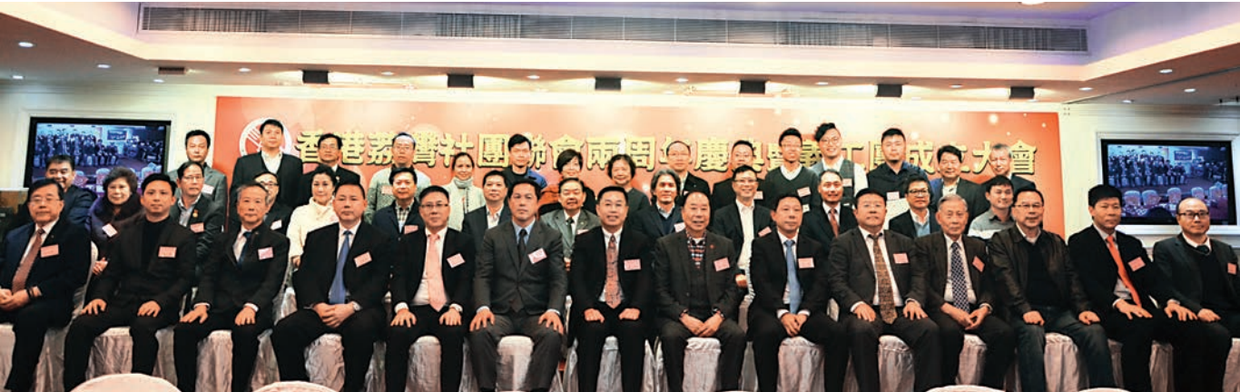
▲荔灣社團聯會兩周年誌慶宴主合照，場面熱鬧

愉快難忘的一年，聯會舉辦了很多社會活動，也吸收了不少朋友加入。在荔灣區政府的大力支持和各位會董的全力配合下，聯會舉辦的各項活動得以圓滿成功，也得到了香港中聯辦、特區政府、廣州市荔灣區等各界人士的肯定。如參與「反辱華反港獨」「反港獨 撐釋法」等活動，都是全力以赴配合香港廣州社團總會行動。