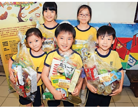
▲一眾同學喜獲由永明金融送贈的食物

「永明金融食物捐贈大行動」由即日起至4月30日期間舉行，捐贈食品以食用限期一年以上、原封包裝又無需冷藏為佳，如罐頭、米糧、食油、麵及小食等，亦接受超市禮券及餅卡的捐贈。有意捐贈的人士，請將食物交到永明金融理財軒（尖沙咀廣東道15號永明金融大樓8樓）或鮮魚行學校（大角咀詩歌舞蹈街33號）。活動期間，凡讀好永明金融的Facebook專頁（http://www.facebook.com/sunlifeHK），永明金融即捐出港幣2元購買食物，贈予鮮魚行學校的學童。