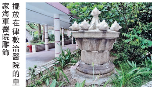
擺放在律敦治醫院的皇家海軍醫院雕塑

隨著肺癆病受控制，律敦治療養院於一九九一年重建為全科醫院，名為律敦治醫院。醫院平台放置一座麻石雕塑，屬於皇家海軍醫院，同類的裝飾物還有一座，現擺放在肇輝台的傳麗儀護理安老院，兩座古物都沒附有文字介紹，絕大部分人都不知其由來。