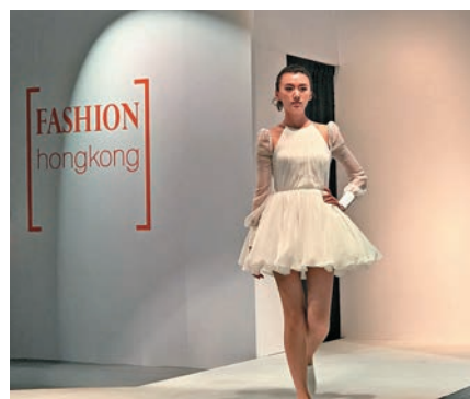
▲上海國際服裝服飾博覽會香港時尚展區時裝匯演