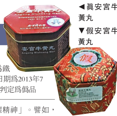
▲真安宮牛黃丸 ▼假安宮牛黃丸

真品在2013年7月開始改為鐵盒獨立包裝，如果標註的生產日期為2013年7月後且包裝為錦盒的話，基本可判定為偽品