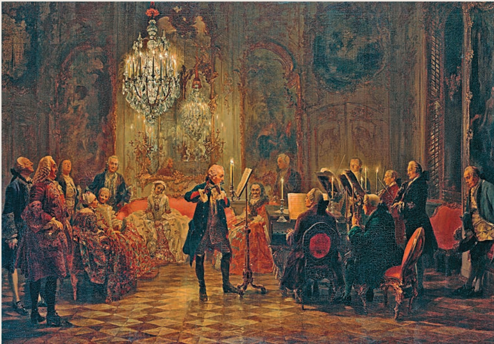
▲阿道夫·門采爾畫作《腓特烈大帝在無憂宮的長笛音樂會》

在一九九〇年兩德統一之後，德國政府於一九九一年將「腓特烈大帝」的遺體運回無憂宮，按照他本人的遺願在無憂宮外他原已為自己修建好的陵墓下葬。一代君王最終得以在他最愛無憂宮無憂無慮地長眠於地下了。而門采爾所為他創作的《腓特烈大帝在無憂宮的長笛音樂會》，則將這座宮殿中曾屬於腓特烈二世和小巴赫的「君臣合作」永遠記錄在了畫布上，供後世欣賞。