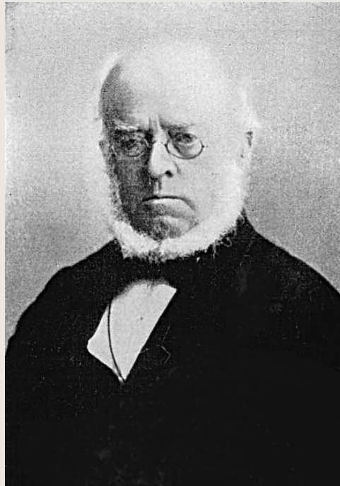
▲德國畫家阿道夫·門采爾 資料圖片

在歐洲十八世紀，隨着古典音樂的飛速普及和發展，熱愛音樂並喜好自己演奏的王侯將相絕不在少數。比如，匈牙利最顯赫的埃斯特哈奇家族（Esterházy）中對藝術貢獻最大，被譽為「偉大的」尼古拉斯一世王子（Prince Nikolaus "the Magnificent"）本人就痴迷音樂，不僅斥重金聘請好的樂手組建自己的宮廷樂