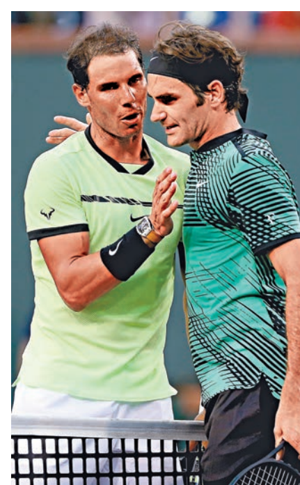
拿度(左)祝賀費達拿取勝。