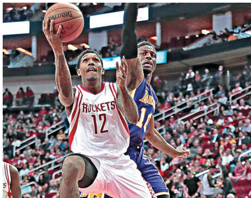
火箭的路易斯威廉士(左)在湖人球員大衛安德華巴緊迫下上籃。

火箭主場對湖人的NBA常規賽昨天上演，火箭在主力射手夏登及倒戈的路易斯威廉士合力打出好球下獲勝，其中夏登取得18分、13次助攻和12個籃板的「三雙」，路易斯威廉士射入七個三分球、錄得全隊最高的30分，協助火箭輕鬆以139：100大勝湖人，賽後火箭取得三連勝，湖人則三連敗。