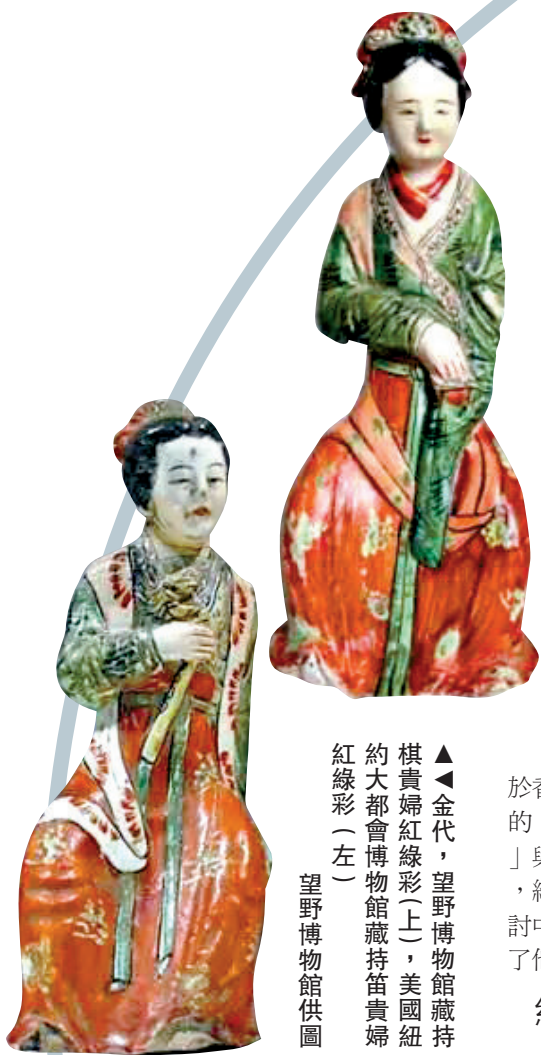
▲金代，望野博物館藏持棋貴婦紅綠彩（上），美國紐約大都會博物館藏持笛貴婦紅綠彩（左）