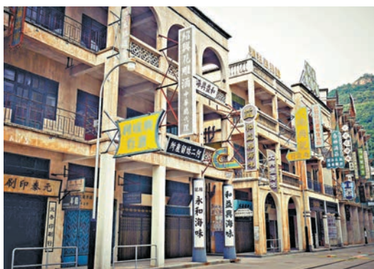
▲佛山積極打造「廣萊塢」推動影視文化產業。圖為西樵山國藝影視城 資料圖片