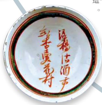
▲金代，望野博物館藏紅綠彩詩文盤 望野博物館供圖