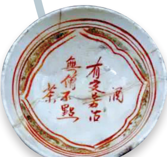
▲金代，望野博物館藏紅綠彩詩文盤