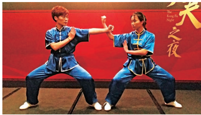
▲在「功夫之夜」上，蔡李佛拳弟子展示南拳風采

而歌星出身的可嵐，小時候曾習武，長大後遵循興趣成了歌手。未來「廣萊塢」計劃拍攝一系列以佛山為題材的電影，她表示有機會想嘗試做「打女」，一展小時候學習的所長。