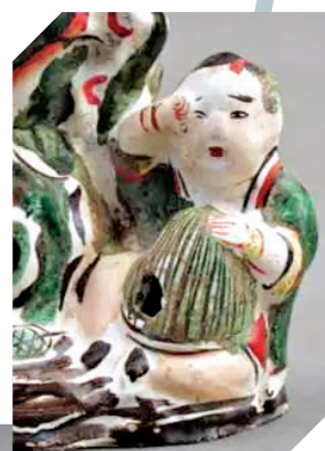
▲假山童子捕雀，上繪孝悌故事