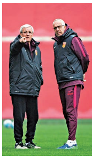
▲中國足球隊主教練納比（左）與助理教練馬達洛尼（右）在訓練中交流

16日，未參加亞冠杯比賽的12名球員率先抵達長沙，連續兩天進行封閉訓練。18日下午的訓練在賀龍體育中心附屬進行，這是全體球員集結完畢後首次合練，向