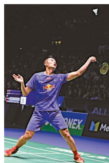
▲林丹目前還未遇到真正對手 資料圖片

面對21歲的小將穆杜化，林丹僅耗時47分鐘便以21:17、21:14取勝，輕鬆打入四強，準決賽的對手是印尼球手安東尼。另一中國男單球手、二號種子石宇奇以21:19、21:11淘汰印度的普拉諾，準決賽對陣中國台北球手王子維。