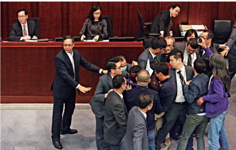
◀多名反對派議員不滿裁決，製造混亂