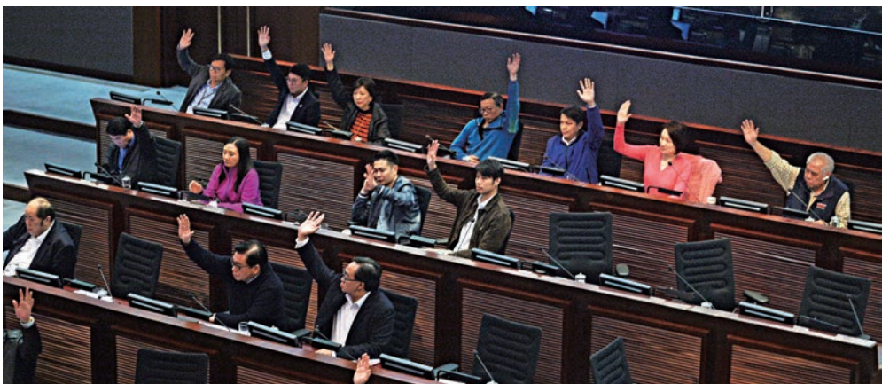
▲涉124億元的基本工程撥款申請，昨日終獲通過

等反對派議員，走到主席台前，多名保安上前攔止。陳健波無暫停會議，撥款申請最終在29票贊成、1票反對下獲得通過。陳健波其後宣布休會15分鐘，但其後議會秩序仍未恢復，陳健波遂宣布提前結束會議，餘下四項議程需要留待下次會議處理。