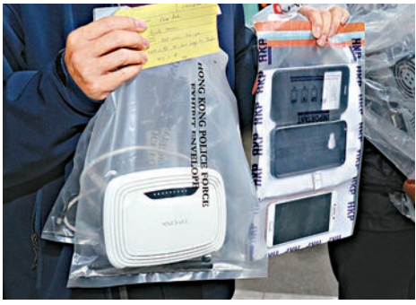
▲警方在逮捕女子家中搜出路由器及手機等證物

【大公報訊】記者周慶邦報道：警方就一連四日在網上電子報案室，接獲四封恐嚇「挑機」揚言炸警署的事件，迅速拘