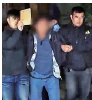
▲被捕男子押走時拒絕戴黑頭套 ▼曾姓村民指曾被疑犯擲物傷腳

【大公報訊】記者周慶邦報道：沙田火炭禾寮坑村的扑殺案，一名涉案男子昨凌晨在現場被警方帶走。警方指死者與疑