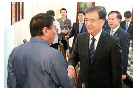
▲3月17日，菲律賓總統杜特爾特在達沃市會見在菲律賓進行正式訪問的中國國務院副總理汪洋。

訪問期間，汪洋與菲律賓內閣經濟管理團隊舉行會談，雙方簽署了《中菲經貿合作六年發展規劃》等合作文件。路透社稱，這份發展規劃涵蓋貸款、項目可行性研究、大橋援建、菲中工業園計劃、水壩、鐵路以及農業經濟培訓。