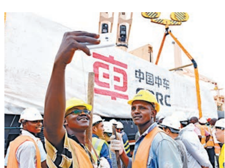
▲1月11日，蒙內鐵路項目首批內燃機車抵達「一帶一路」沿線國家肯尼亞。圖為當地工人自拍留念。

2016年前三季度，中國對澳直接投資同比增長73.3%，跨越10億澳元審查門檻的大型中資項目超過10個。