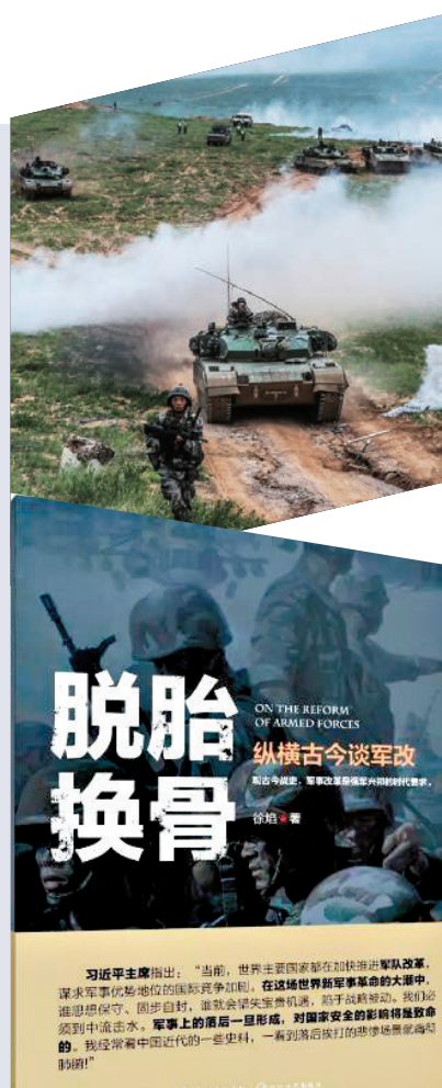
18日，《脫胎換骨——縱橫古今談軍改》見面會在北京舉行，徐焰少將、高良少將共話軍改。