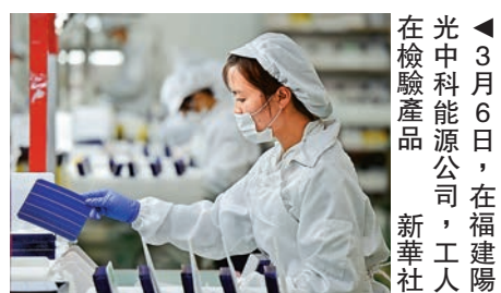
▲3月6日，在福建陽光中能源公司，工人在檢驗產品。

不可或缺的部分，過去幾年中國經濟對世界經濟增長的貢獻率在30%以上。展望未來，中國經濟轉型將有效減緩世界經濟不確定性，為世界經濟復甦注入新動力。