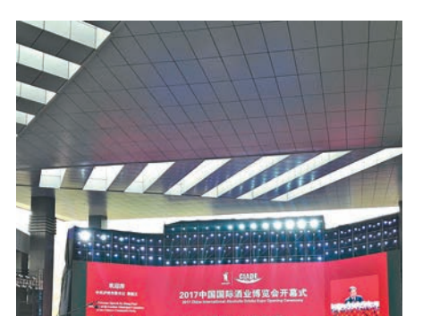
2017中國國際酒業博覽會在「中國酒城」四川瀘州開幕