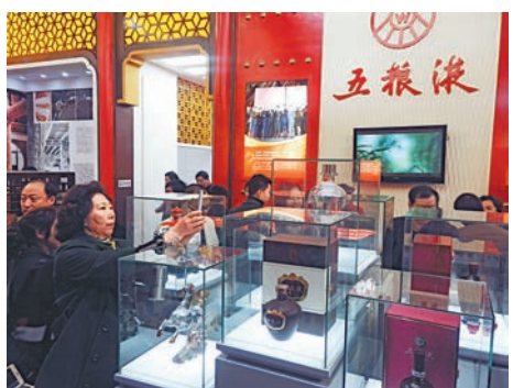
一線酒企的營收和利潤均有回升，白酒行業築底反彈跡象明顯

中國國際酒業博覽會是經國家商務部批准舉辦的唯一國際酒類專業展覽會，自2008年起已經成功舉辦九屆，吸引來自36個國家和地區的600多家企業及各類專業採購商、經銷商和品牌運營商近兩萬人參展，國內外品牌超1000個。酒博會還首次聯合「天貓」「蘇寧」及「微信大賣吧」，舉辦線上線下產品推廣、網絡大V酒博行、AR移動全景看酒博等互動活動。