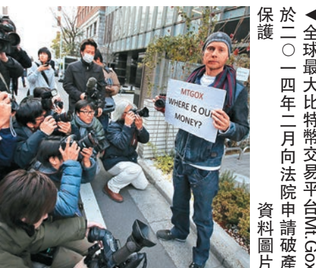
全球最大比特幣交易平台Mt. Gox於二〇一四年二月向法院申請破產保護 資料圖片

不過，過去比特幣也出現一些風險事件。2014年2月，全球最大比特幣交易平台Mt. Gox以技術故障為由，停止用戶提現的服務，同月正式向法院申請破產保護。美國比特幣交易平台Buttercoin稍後也表示，公司因無法喚起風險資本足夠的興趣繼續投資，將於當年四月關閉其服務。