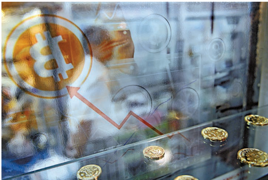
雖然內地對比特幣的監管將日趨嚴緊，但有分析認為，由於供應總量仍有限，其價格將隨着時間的推移增加

長期而言，比特幣虛擬商品交易平台需實施綜合監管，包括金融信貸、反洗錢、外匯管理、業務範圍、廣告宣傳、稅收等方面。地方金融監管部門應盡快對其建立主體監管機制。