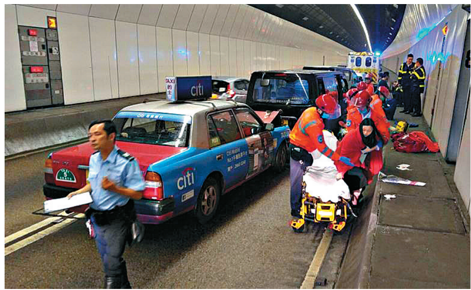
▲城門隧道五車串燒交通意外現場

周續稱，警方正緝拿及調查縱火男子犯案的動機，並會逐一聯絡受影響的車主，了解是否曾與人結怨等。初步調查顯示事件不涉黑社會尋仇，而首先被縱火車主是否涉及金錢糾紛亦是調查方向之一。據悉，遭縱火的私家車車主從事保險業，有人向警方承認曾與人結怨，早前曾被人無故毆打受傷。