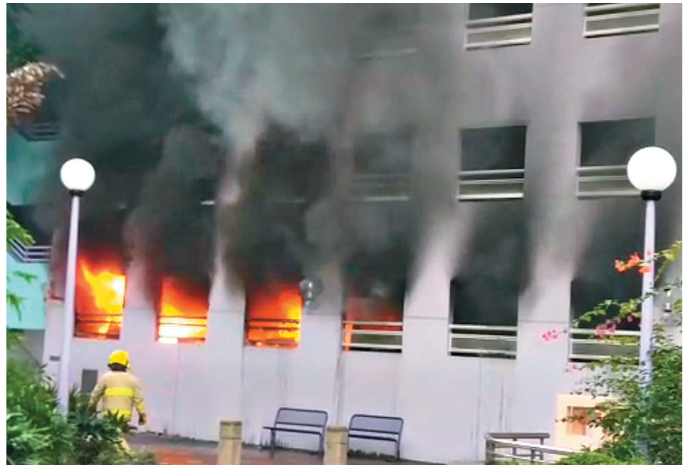
▲樂富富強苑停車場火燒車案，停車場火光熊熊，黑煙狂噴

現場為黃大仙富強苑內多層停車場底層。昨晨9時30分，一輛停泊上址車位私家車首見起火，火勢迅速蔓延，火舌先波及右邊一輛寶馬房車及左邊一輛七人車，再蔓延燒着其他車輛，停車場頓成火海，冒出大量濃煙，並傳出爆炸聲。