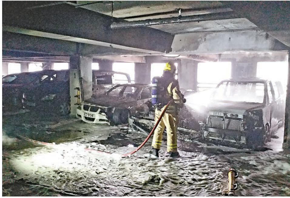
▲煙帽隊進入火場，開動化學泡沫喉灌救

前曾有一名年約25至30歲、1.7米高、蓄短黑髮，身穿黑色長袖運動衫、牛仔褲、白色波鞋的男子，涉嫌向其中一輛私家車淋潑易燃液體後縱火。