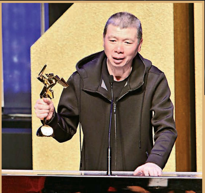
▲馮小剛的《我不是潘金蓮》獲「最佳電影」，他表示將會為觀眾繼續拍好戲