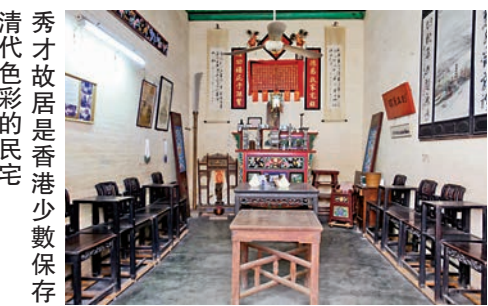
秀才故居是香港少數保存清代色彩的民宅

香港很少房屋像秀才故居般如實地展示清代居住環境，屋內布置古舊，主廳有一座五彩雕花神台供奉祖先，牆上掛了寫滿神名的牌子。隔壁是磨房（碓間），過去只有富裕人家才闢此室給傭人磨穀和舂米。此屋已列為二級歷史建築，鄧先生曾與古蹟辦接觸，希望政府接收，但一直未有協議，否則屏山文物徑可增添一個獨特景點。