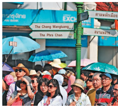
▲調查顯示大中華區富豪最愛移民去東南亞。圖爲中國遊客在泰國 資料圖片

來自大中華區的24位移民富豪，去東南亞的最多(14人)，其次是美國(9人)，再次是澳洲(1人)。(記者 孫琳)