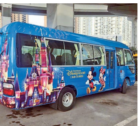
▲上海迪士尼穿梭巴士

據悉，在展覽展出期間，凡是參觀展覽的遊客都可以在紀念館內爲自己的家人現場寫信，由紀念館負責郵寄，共同爲家人帶去久違的美好祝福。(記者 李陽波)