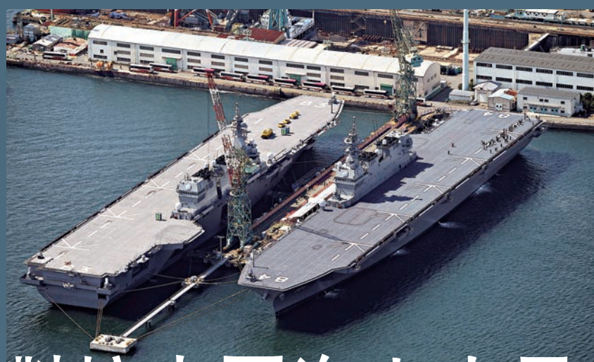
右和「出雲」號(左)

【大公報訊】綜合共同社、《朝日新聞》、中央社報道：日本海上自衛隊新型直升機護衛艦「加賀」號22日在橫濱舉行入列儀式正式服役。排水量近2萬噸的「加賀」號，是第二艘「出雲級」戰艦，也是日本海上自衛隊第四艘直升機護衛艦。分析指，「加賀」號主要針對中國海上力量。