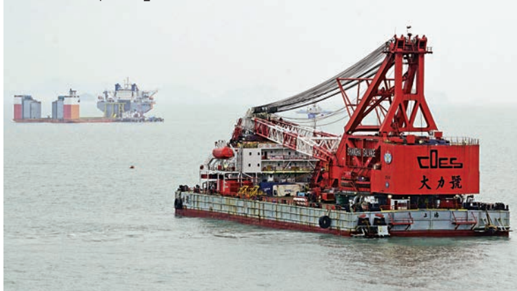
一艘吊船22日在濟州島附近海域準備開始對打撈「世越」號進行測試

雖然日本政府強調不會擁有攻擊型航空母艦，強調「加賀」只是防禦型航艦。而「加賀」與美軍的核動力航艦相比，也確實無法搭載一般的固定翼戰機，成員也只有十分之一不到。但美軍陸戰隊專屬的F-35B可以短場垂直起降，若結合海上自衛隊的直升機護衛艦，將成為強大的海上攻擊戰力，而日本境內目前確實也有美軍的F-35B駐守岩國基地。《每日新聞》說，日本政府內也有主張應向周邊國家強調此點，藉以發揮無形的抑制力。今後日本海上自衛隊如何運用這幾艘護衛艦，也成為東亞國家的矚目焦點。