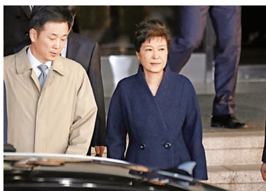
韓國前總統朴槿惠22日離開檢察廳

進行了較長時間。調查本身早在前一天晚上11點40分左右就已結束，但朴前總統仔細閱覽調查紀錄，花費了7個多小時。以她進入中央地方檢察廳和出來的時間計算，調查整整進行了21小時零30分鐘。