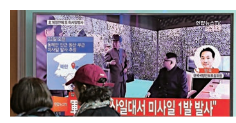
首爾商場裏的電視上播放有關朝鮮領導人金正恩的新聞

【大公報訊】據韓聯社、《美國之聲》報道：朝鮮半島局勢不斷升溫之下，3月22日，朝鮮再次發射了導彈，但以失敗告終。韓國媒體援引韓國國防部的消息稱，當地時間22日上午，朝鮮在其江原道元山一帶發射數枚導彈，但疑似並未取得成功，美國和韓國都沒有具體說明朝鮮試射導彈的類型。