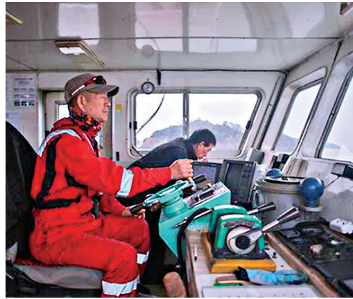
打撈人員駕駛船隻在現場視察情況

載有476人的「世越」號客輪於2014年4月16日在全羅南道珍島郡附近水域沉沒，導致295人遇難，9人下落不明。2015年8月，韓國OCEANC&I公司與上海打撈局組成的中韓打撈聯合體啓動「世越」號打撈準備作業。