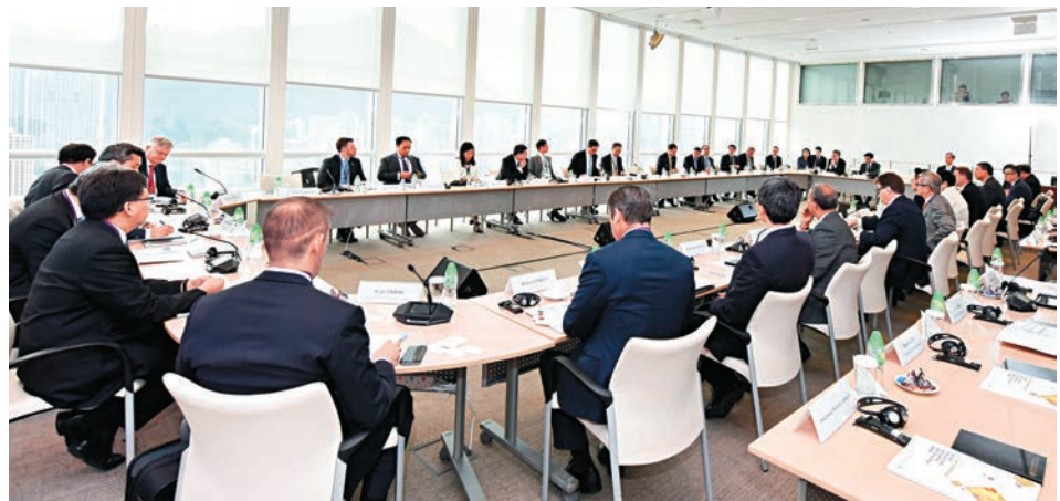
▲金管局在23至24日主辦首個債權融資及投資者圓桌會議，大約100名高級管理人員參加

【大公報訊】記者黃裕慶報導：香港金融管理局去年批出儲值支付工具（SVF）牌照之後，昨日首次公布相關的季度統計資料。在去年第四季，個人對個人轉帳的總交易量為25萬宗，總交易金額則為5.37億元。截至2016年底，使用中的SVF總數共有4049.1萬個帳戶。儲值金額及工具按金總額約為67.84億元。