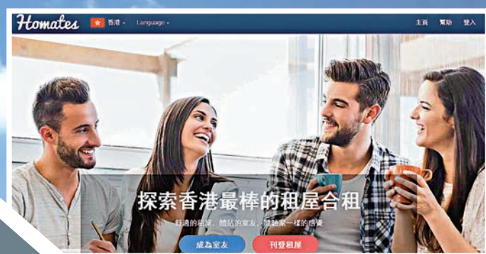
▲ Homates 可以選擇室友或出租單位 網頁截圖