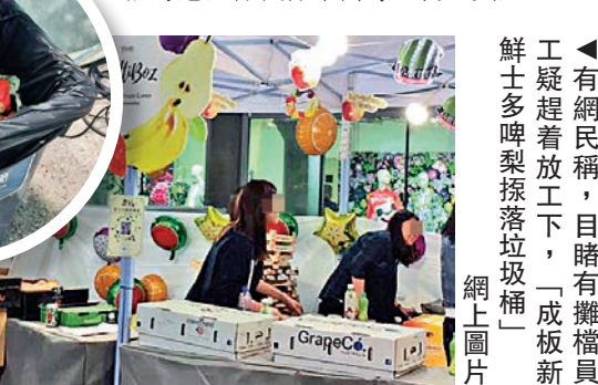
◀ 有網民稱，目睹有攤檔員工趕着放工下，「成板新鮮士多啤梨探落垃圾桶」