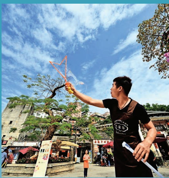
▲甘坑如今已是深圳人喜愛的周末度假地