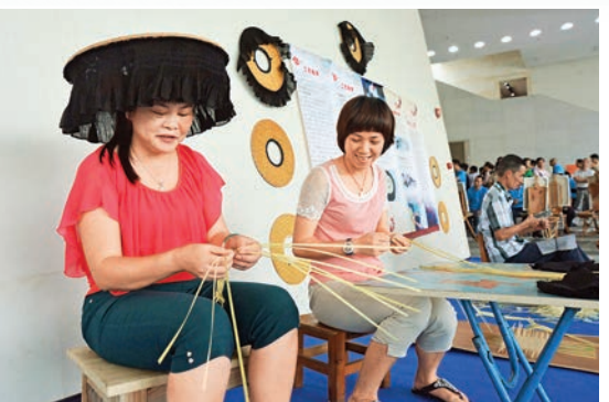
▲甘坑居民為觀眾演示編織涼帽