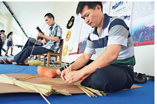
▲編織涼帽，男子漢亦有好手藝