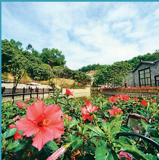
▲悠悠甘坑河見證村落變遷