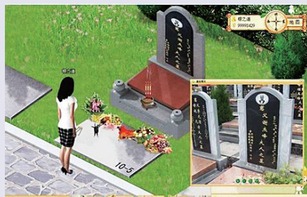
▲3D網上墓地 網絡圖片