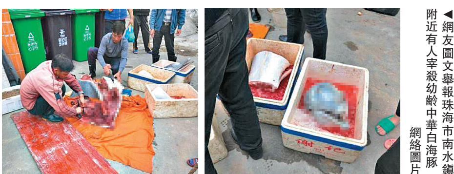
▲附近有人宰殺幼齡中華白海豚

【大公報訊】記者方俊明珠海報道：有網友在3月30日舉報稱珠海市南水鎮附近發現有人宰殺國家一級保護動物、有「海上熊貓」之稱的幼齡中華白海豚，引發熱議。記者31日從珠海市海洋農業和水務局等多部門的通報會上獲悉，多個相關職能部門組成的聯合調查小組已趕赴事發地開展調查，並把南水鎮飛沙村的3名涉事村民傳喚到當地公安機關協助調查，將部分殘留骨肉樣本送去鑒定，結果將盡快公布。