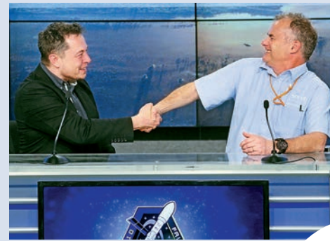
▲SpaceX行政總裁馬斯克（左）與環球衛星公司（SES）首席技術官哈利韋爾慶祝發射成功

未來，SpaceX預計將發射更大、功能更強、可在軌補充燃料的火箭，最終希望回收所有部件和燃料供給工具。除此之外，SpaceX還計劃明年送兩位付費旅客到月球，並希望能在2020年用該公司正在發展的機器太空船將人類送往火星。