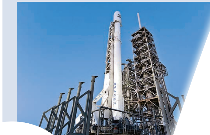
▲等待發射的「獵鷹9」