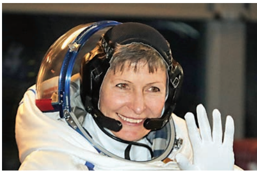
▲美國女太空人惠特森 資料圖片