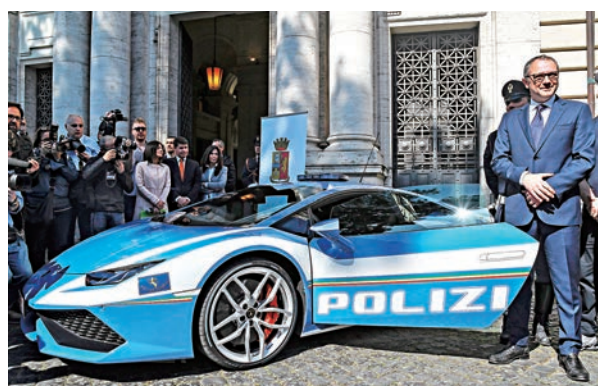
▲林寶堅尼新警車3月30日亮相