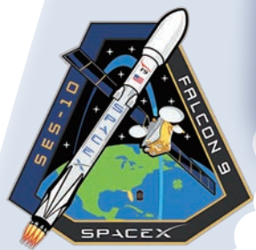
▲此次發射任務標誌 SpaceX