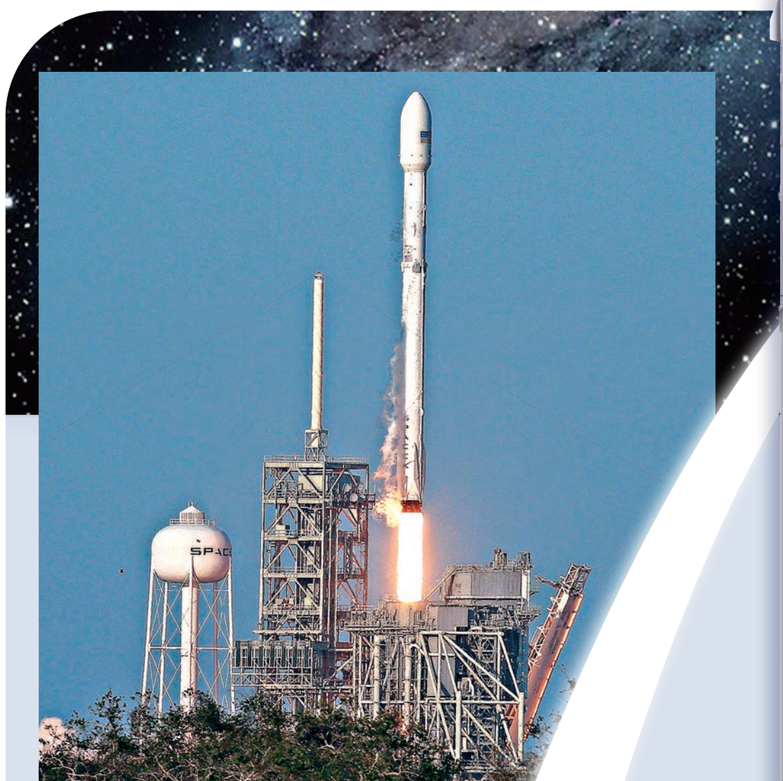
▲「獵鷹9」火箭在美國佛羅里達州肯尼迪航天中心發射