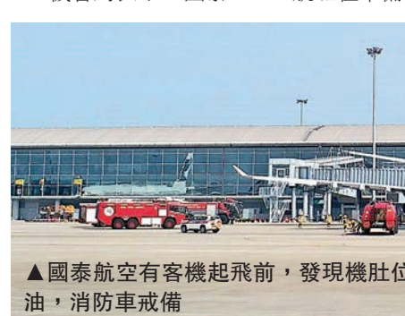
▲國泰航空有客機起飛前，發現機艙位置漏出燃油，消防車戒備

起飛期間，發現有輕微燃油溢出情況，局方已按機制通知消防員到場並開喉戒備，機場運作不受影響。