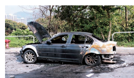
▲屯門福亨村路有寶馬房車遭縱火燒毀