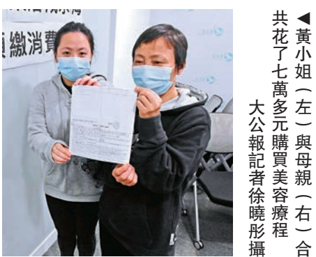
▲黃小姐（左）與母親（右）合共花了七萬多元購買美容療程

向政黨求助的市民黃小姐稱，2015年與母親在一家美容院各花21000元購買42次美容療程為期一年的美容套票，起初約十