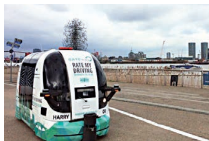
▲倫敦格林威治將進行無人車測試 網上圖片

況，也會緊急煞車。英國工業大臣赫德表示，英國在汽車行業一向善於發明創新，這種先進的無人駕駛技術在安全方面將更有保障，可為老人和殘疾人士提供更多便利。Oxbotica公司亦表示，相信這些無人車可以對格林威治的交通狀況有所改善。