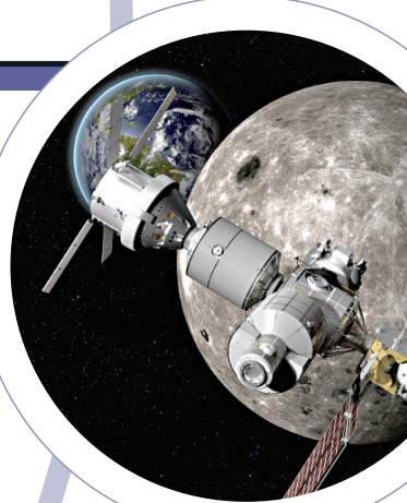
▲「深太空通路」概念圖

測試車輛將在約3.2公里長的河濱路線上進行測試，路線接近倫敦O2體育場。車上裝有五個攝影機和三個雷射裝置，能辨認前方一百米的狀況，如果發現障礙物，會自動平穩停車；如遇特殊狀