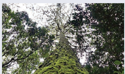
▲全球一半以上種類樹木生存環境不樂觀

國際植物園保護聯盟表示，由於每年都有大量新發現的樹種，這份數據很容易出現變動。他們會在每個新樹種被命名時，及時更新數據。