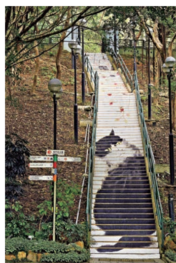
▲荃灣城門谷公園樓梯畫作為歐陽乃霏《蝶蘭》

該項目由康樂及文化事務署主辦，香港藝術館籌劃，由政府「二十周年慶典基金」撥款，首季製作、設計及保養費用共計六十萬元，並於昨日在香港文化中心露天廣場舉行啟動儀式。民政事務局長劉江華、博物館諮詢委員會主席黃遠輝、博物館諮詢委員會藝術專責委員會主席羅榮生、創不