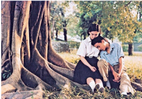
▲《牯嶺街少年殺人事件》劇照