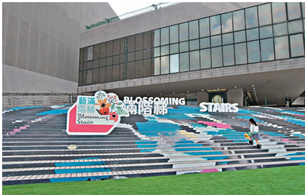
▲香港文化中心樓梯，以吳冠中《春雨》裝點

查詢有關「城市藝裝計劃：藝滿階梯」和教育活動詳情，可瀏覽網頁、facebook專頁或電二七二一〇一一六。