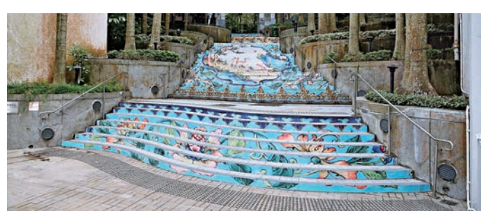
▲香港公園樓梯以《銅胎畫琺瑯開光「三羊啓泰」、「荷花鴛鴦」紋暖手爐》進行裝飾