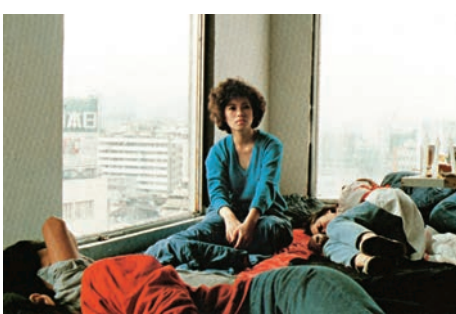
▲電影《青梅竹馬》