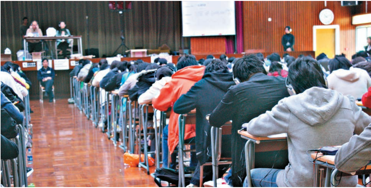
◀中學文憑試中文科聆聽及綜合能力卷昨早開考，但部分以紅外線接收系統播放的試場，因技術問題，令萬名學生延遲開考，圖為過往考試情況

考評局強調，有關試場開考時間因而延遲，但亦相應調整完卷時間，考生的聆聽及作答時間均不受影響。考評局已即時檢視明日（四月八日）舉行的英文科聆聽考試錄音的USB，確保檔案格式無誤及當日考試能順利舉行。考評局常設委員會將會調查及數據分析，評估事件對有關考生表現有否造成影響，以作出適當跟進。局方亦會檢視複製錄音檔案的程序，盡力避免同類事件重演。