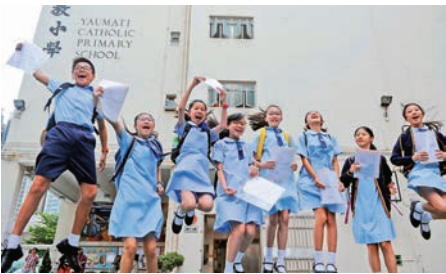
▲下學年英中學額減少，加上人口回升，估計學子想爭入心儀英中會更加困難

【大公報訊】經歷多年適齡中一學生人數下跌後，新學年人數終於止跌回升。教育局預計有4.78萬名小六生參與今年九